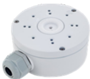
INT-MAC-M07-A01 Монтажная коробка