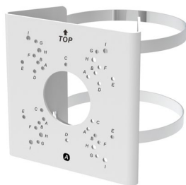
INT-MAC-A07-A01 Адаптер для крепления на столб